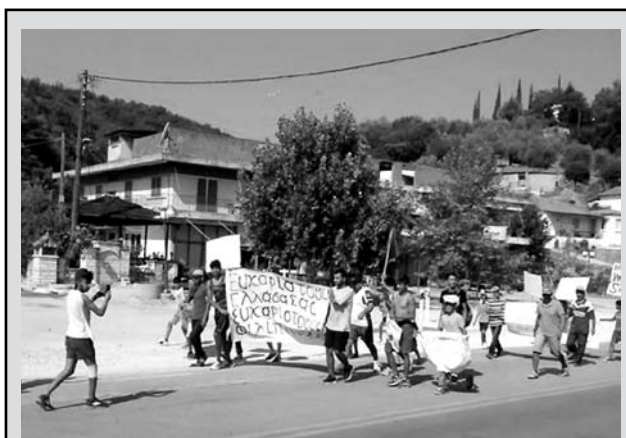
Πρόσφυγες διαδηλώνουν στη Φιλιππιάδα την 1η Σεπτεμβρίου, κρατώντας πανό «Ευχαριστούμε Ελλάδα»...